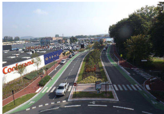
Figure 1 : Exemple de réalisation pendant et après travaux : Boulevard Bréguet à DOUAI (Utilisation de structures alvéolaires ultra-légères implantées sous les espaces verts)