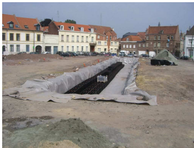
Figure 2 : Place Saint Amé à DOUAI accueillant le marché aux légumes du samedi