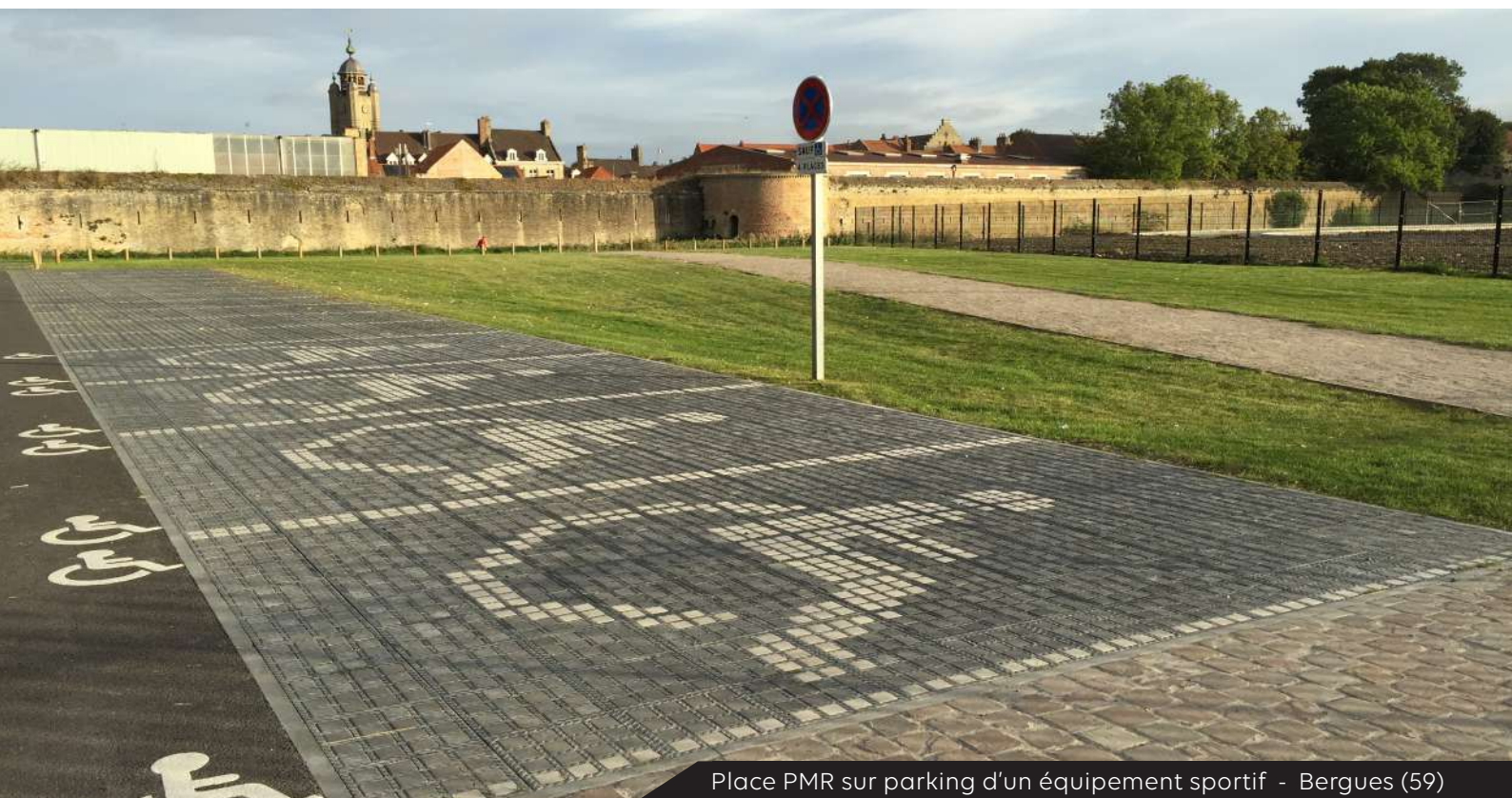
Place PMR sur parking d'un équipement sportif - Bergues (59)