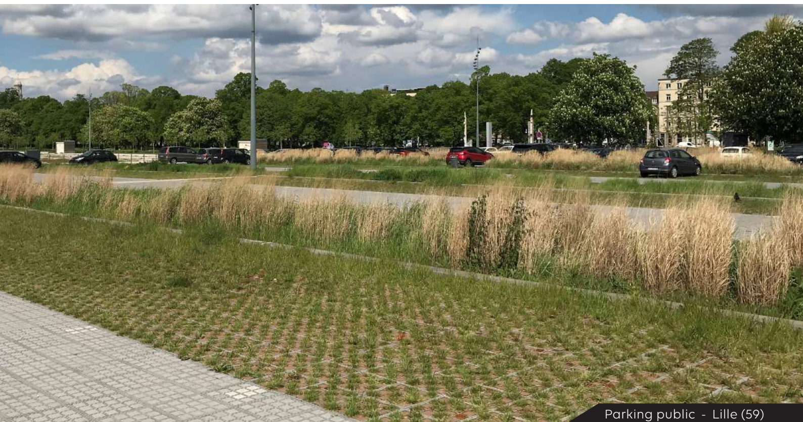
Parking public - Lille (59)