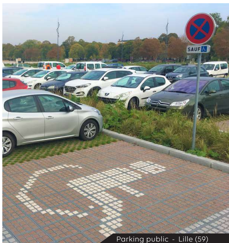
Parking public - Lille (59)