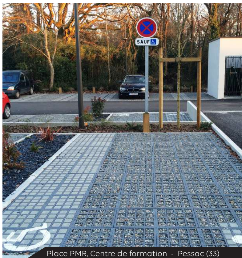
Place PMR, Centre de formation - Pessac (33)

Le système O2D GREEN® allié au système O2D PAVE® permet de végétaliser l'intérieur des places PMR en garantissant la sécurité des usagers par la mise en œuvre d'une bande de cheminement pavée.