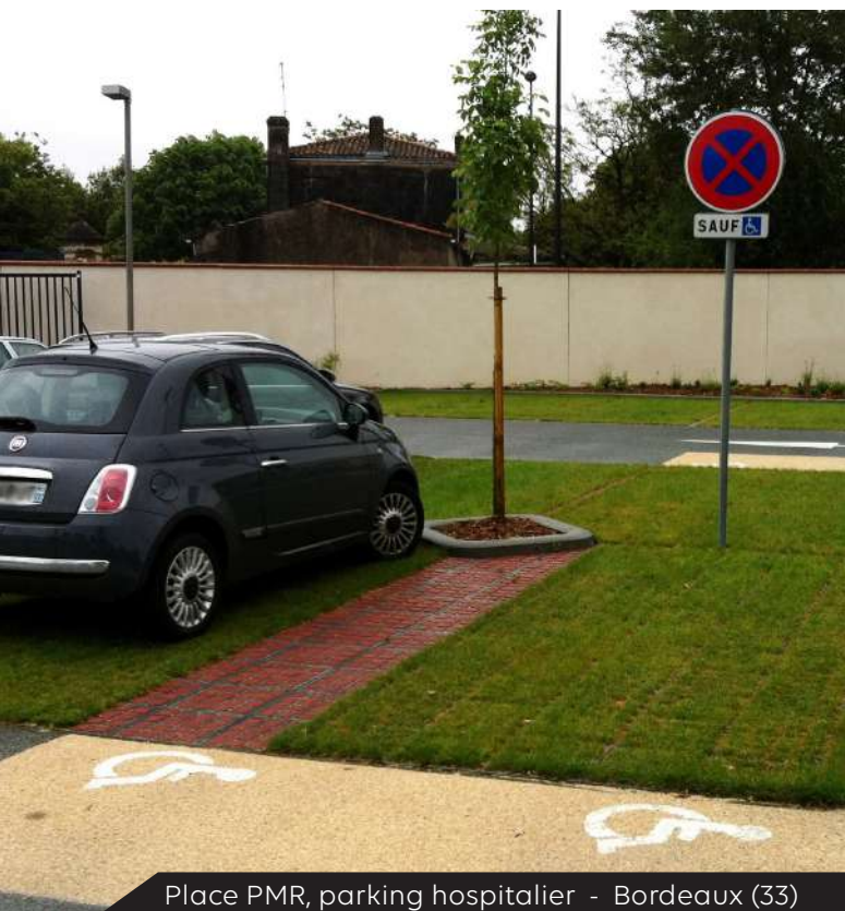
Place PMR, parking hospitalier - Bordeaux (33)

Le système O2D GREEN® allié au système O2D PAVE® permet de végétaliser l'intérieur des places PMR en garantissant la sécurité des usagers par la mise en œuvre d'une bande de cheminement pavée.