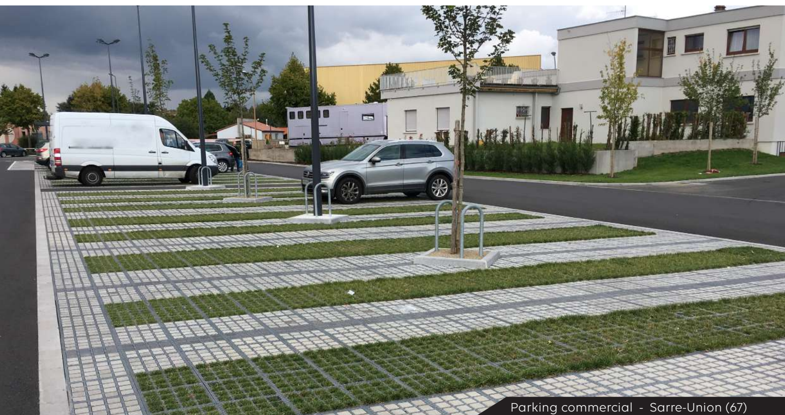
Parking commercial - Sarre-Union (67)