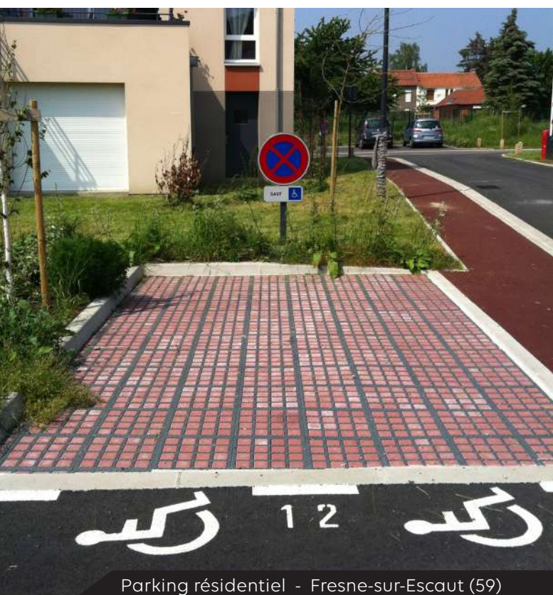
Parking résidentiel - Fresne-sur-Escout (59)