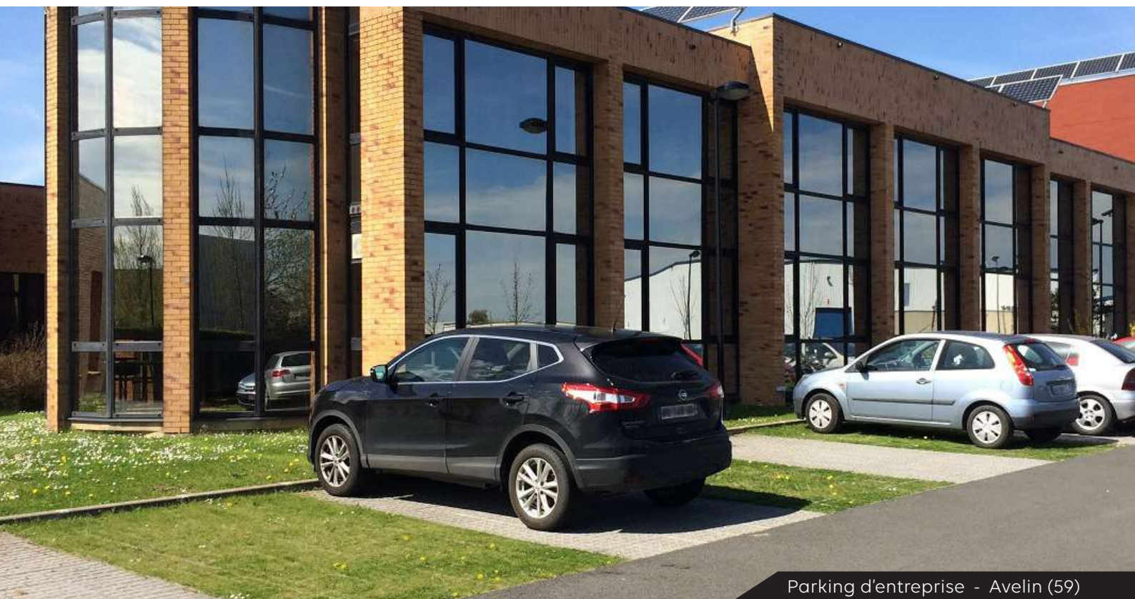
Parking d'entreprise - Avelin (59)